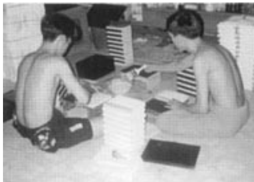
Vietnamští křesťané tajně zhotovují Nové Zákony ve svém kmenovém jazyce.

Zprávy, které přicházejí z Vietnamu, naznačují, že tamní vláda zintenzivňuje pronásledování etnických věřících. Podle misijní rozhlasové společnosti Far East Broadcasting, sdělil jistý křesťan z kmene Hmong, že vojáci a policisté střeží všechny křesťanské vesnice a pečlivě sledují jejich obyvatele. „Nemůžeme již nadále konat společná shromáždění. Policisté často přicházejí do křesťanských domácností a hledají Bible, zpěvníky a křesťanskou literaturu. Cokoli naleznou, ihned spálí.“ Úřady od každé domácnosti požadují, aby měla vystaveného „zlého ducha“ na důkaz, že je v rodině uctíváno tradiční animistické učení. Pokuta za neuposlechnutí tohoto nařízení je v přepočtu asi 320 Kč, což je pro tamní kmenové rolníky, kteří vydělávají 100 Kč měsíčně, velká částka.